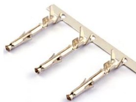
Контакты для MFB-...M