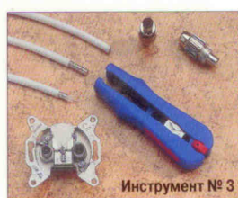
Инструмент № 3