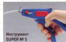
Инструмент SUPER № 5