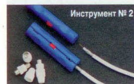
Инструмент № 2