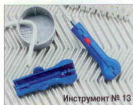
Инструмент № 13