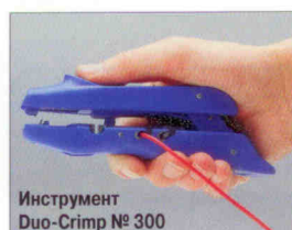
Инструмент Duo-Crimp № 300