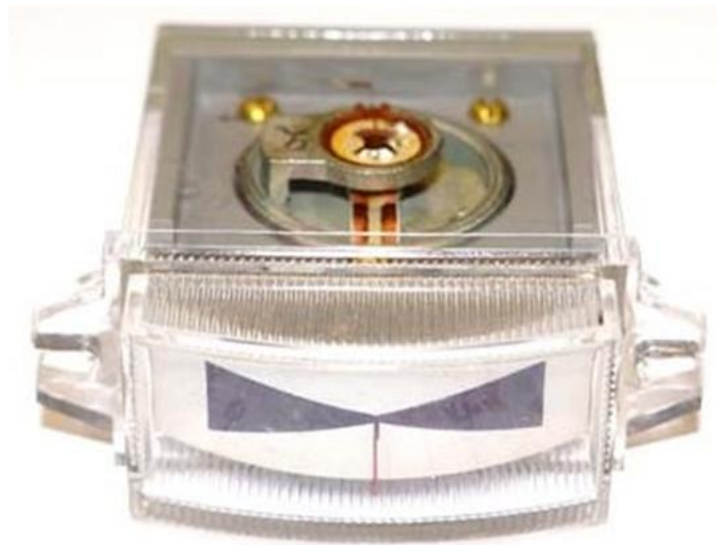
Габаритные и установочные размеры

Головки предназначены для измерения тока. Устанавливаются в щитах и панелях малогабаритной аппаратуры, как в вертикальном, так и в горизонтальном положении. Устойчивы к ударам и вибрации. Степень защиты, обеспечиваемая корпусами приборов М4248, соответствует - IP53. Степень защиты токоведущих выводов – IP00.